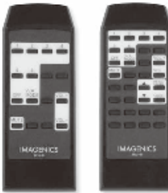
IR-HT1-16 (SL-41B用) IR-HT1-32 (SL-41B用)