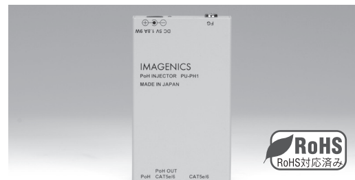
PU-PH1 FRONT PANEL

DVI/HDMI関連の機器・ケーブルは、すべて弊社製品での構成を推奨します。一部の他社製品(海外製を含む)との混在組み合わせでは、規定の性能を維持できず思わぬ不具合が発生する場合があります。この場合、弊社製品の動作を保証できない場合があります。